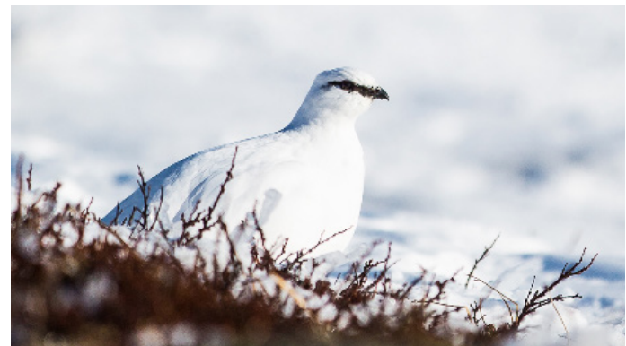
BRF ÅRE BERGBANA