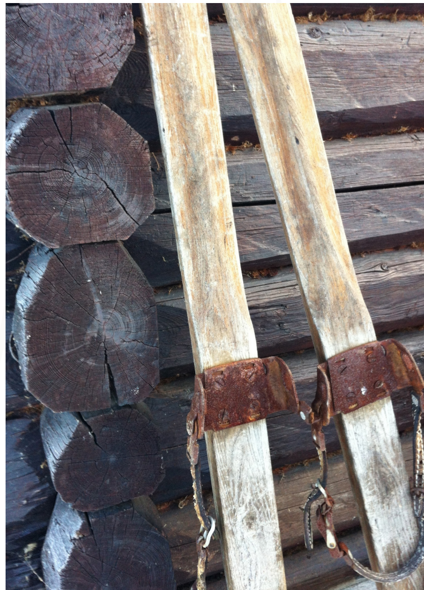
BRF ÅRE BERGBANA